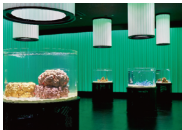
ゆるやかに「いろ」が変化する世界。美しく澄み切った13台の水槽で泳ぐ、あか、あお、きいろ、色鮮やかな魚たち。

NIFREL (ニフレル) は、万博記念公園内の複合商業施設「EXPOCITY (エキスポシティ)」内にある施設で、近鉄グループである(株)海遊館が初プロデュース。「感性にふれる」をコンセプトに、水族館・動物園・美術館のジャンルを超えた、子どもから大人まで幅広い世代の感性を豊かにする「生きているミュージアム」です。