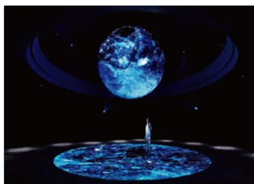
宇宙から星を眺めるような神秘的な空間アート体験。水の彫刻や花木、宇宙などが球体に描かれ、あなたに光のシャワーが降り注ぎます。