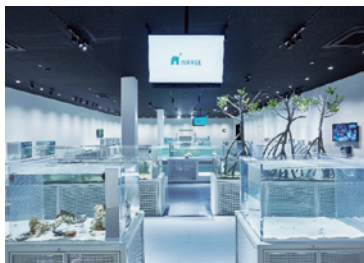
水を噴く、砂に隠れる、まわりと同じ色に変化する。生きものたちのオリジナリティあふれる「わざ」に、ふれやすく工夫された水槽でキュレーターがわかりやすく解説します。