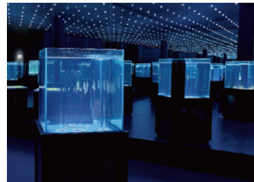
光のドットが無限に続く空間に浮かぶ、生きものたちの不思議な「すがた」。美しい造形物と生きもの個性が調和したアーティスティックな水槽が私たちを魅了します。