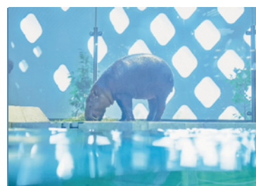
木立をイメージした空間を抜けて、光が差す開放的な空間へ。「みずべ」に住む生きものが大迫力でお出迎えます。猛獣や珍しい生きものに驚きと感動の連続です。