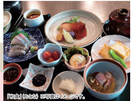
「和食」(おとな) ※写真はイメージです。

メイン料理も肉料理、魚料理から選択。 ※食材の仕入れ、季節等により料理内容が変更になる場合があります。