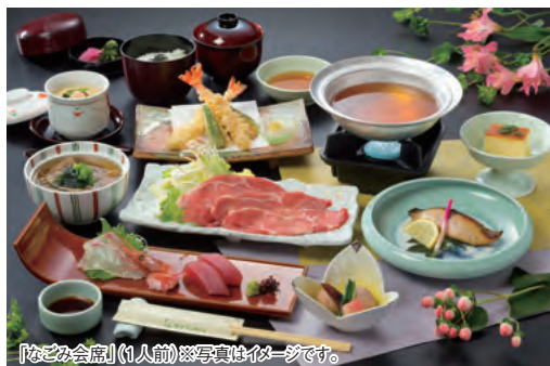
「なごみ会席」(1人前)※写真はイメージです。

※但し、毎週金曜日と4月8日～11日、5月1日～6日、7月7日～12日、8月9日～17日、9月9日～12日は除きます。 ※その他不定休があります。