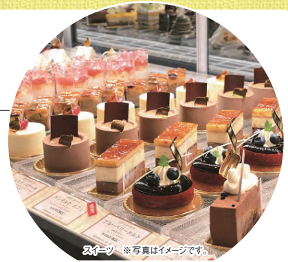
スイーツ ※写真はイメージです。

「癒し」と「食」をテーマにした複合温泉リゾート。 100%源泉かけ流しの「片岡温泉」と有名シェフ監修の料理をご堪能ください。