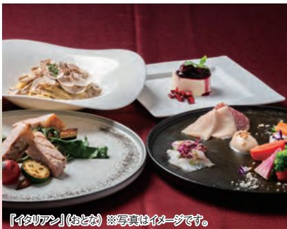
「イタリアン」(おとな) ※写真はイメージです。