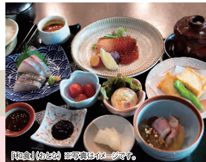
「和食」(おとな) ※写真はイメージです。