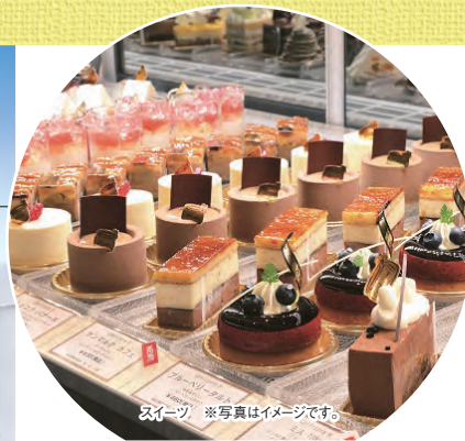
スイーツ ※写真はイメージです。

「癒し」と「食」をテーマにした複合温泉リゾート。 100%源泉かけ流しの「片岡温泉」と有名シェフ監修の料理をご堪能ください。