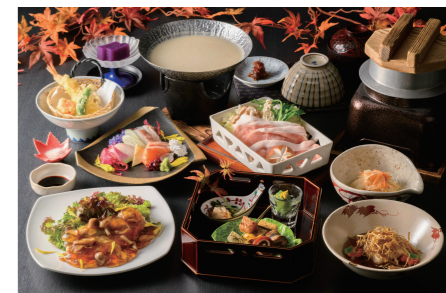
会席料理 ※写真はイメージです。

旅行代金 (お一人様) 旅行代金には、近鉄運賃、三重交通 (みちくさきつぷ)、宿泊代 (1泊夕・朝食付き) および諸税等が含まれます。 ○下記旅行代金は大阪発着 (大阪・京都→奈良→伊勢→大阪・京都) の料金を掲載しております。 復路名古屋方面 (大阪・京都→奈良→伊勢→名古屋) への料金はお問い合わせください。 ○特急料金やしまかぜ等、特別車両料金は含まれていません。 チケットレスで予約変更可能なインターネット予約・発売サービスをご利用ください。(詳しくは裏面をご覧ください) ○他駅の設定料金はお問い合わせください。