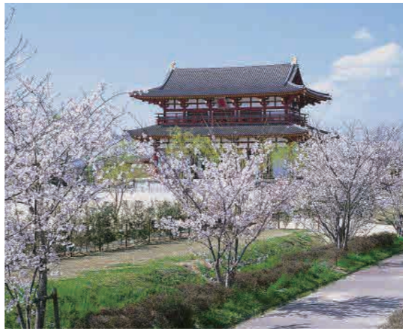
大和北大寺駅から近鉄奈良駅への車窓からは平城宮跡が見えます。