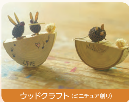
ウッドクラフト (ミニチュア創り)