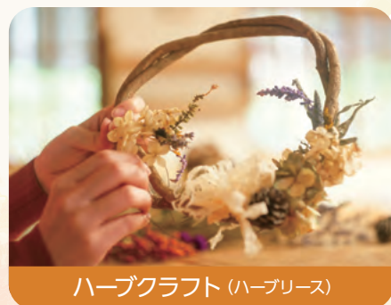
ハーブクラフト (ハーブリース)