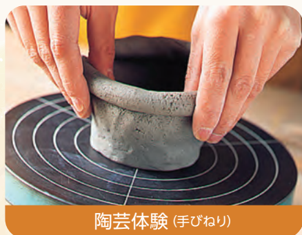
陶芸体験 (手びねり)