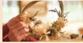
ハーブガーデンで収穫した季節のハーブリース

ハーブリース、ハーブ染め、ハーブアレンジから事前に選択いただけます。 スタート時間:10:00～、13:00～、15:00～(所要時間 約90分)