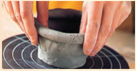
完成品は約2ヶ月後の送付となります。(着払い)

手ろくろで陶芸にチャレンジ!お茶碗や湯のみなど自由にお創りいただけます。 スタート時間:10:00～、13:00～、15:00～(所要時間 約90分)