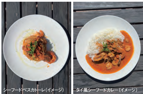
シーフードパスタ(イメージ) タイ風シーフードカレー(イメージ)

食事場所 マリーナ河芸 CAFÉ&BBQ MERMAID (マーメイド) 食事時間 12時30分～