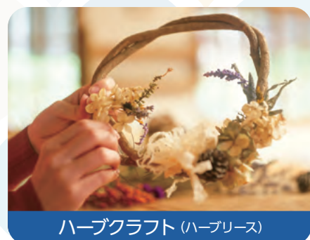
ハーブクラフト (ハーブリース)