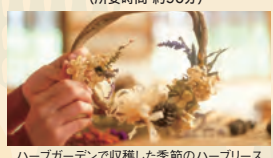
ハーブガーデンで収穫した季節のハーブリース

ハーブリース、ハーブ染め、ハーブアレンジから事前を選択いただけます。スタート時間：10:00～、13:00～、15:00～(所要時間 約90分)