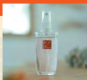
ルームフレグランス