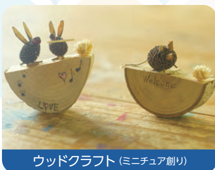
ウッドクラフト (ミニチュア創り)