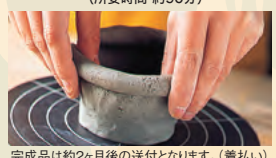
完成品は約2ヶ月後の送付となります。(倉払い)

手ろくろで陶芸にチャレンジ! お茶碗や湯のみなど自由にお創りいただけます。スタート時間：10:00～、13:00～、15:00～(所要時間 約90分)