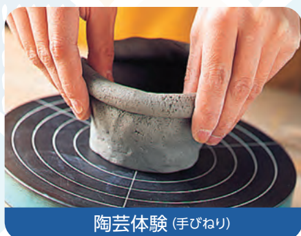
陶芸体験 (手びねり)