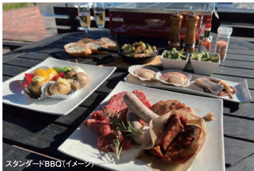
スタンダードBBQ(イメージ)

食事場所: マリーナ河芸 CAFÉ&BBQ MERMAID (マーメイド) 食事時間: 12時30分～