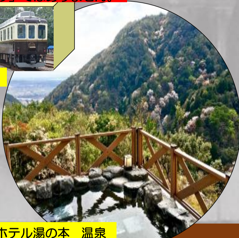
ホテル湯の本 温泉