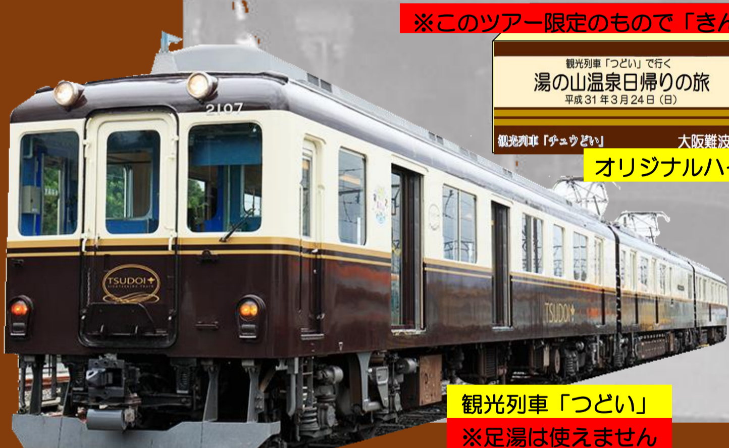
観光列車「つどい」 ※足湯は使えません