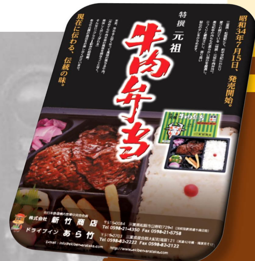
オプションの「あら竹 特選牛肉弁当」

※貸切列車停車駅：大阪上本町・鶴橋・布施・近鉄八尾・河内国分・大和高田・大和八木・名張