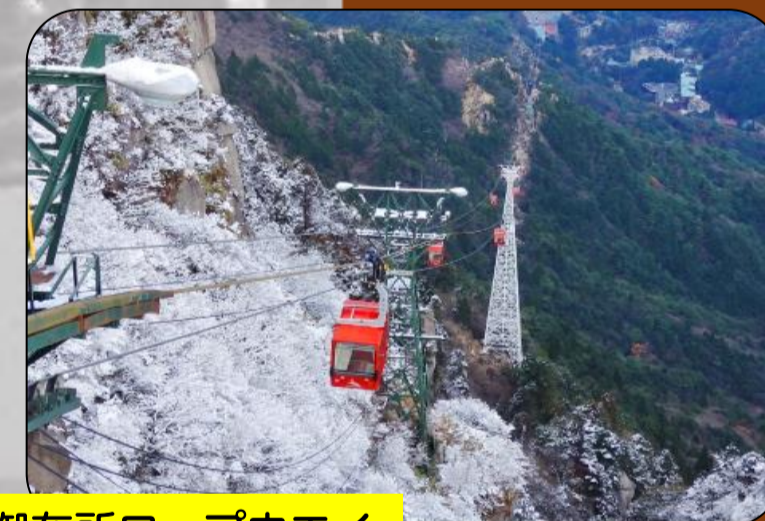
御在所ロープウェイ