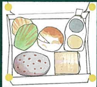
大和の食材を使用したスイーツ

磯城野高校産の大和野菜を使用した 高校生手作りお弁当、スイーツをご提供 楽しいイベントや校内で加工した商品などの 車内販売もあります!