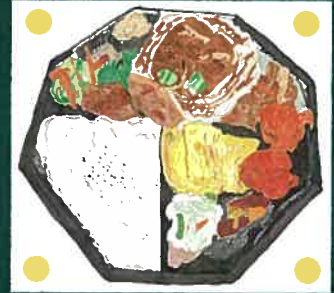
大和野菜を使用したお弁当