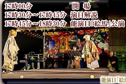
画像、イラストはイメージです。