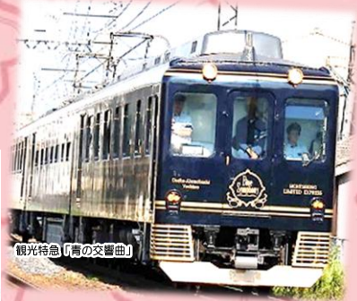
観光特急「青の交響曲」