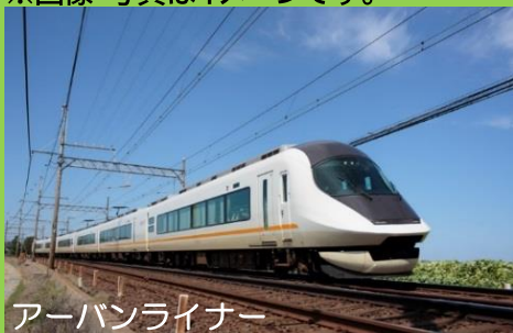
アーバンライナー