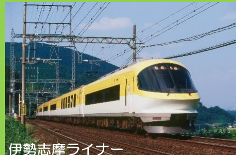
伊勢志摩ライナー