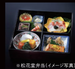
※松花堂弁当(イメージ写真)