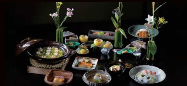
※10月~12月イメージ写真