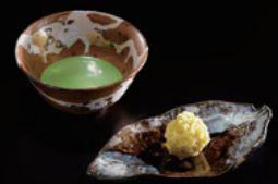
※お抹茶と季節の和菓子

行程(宿泊) 一日目 発駅 近鉄電車 +++ 京都駅 送迎車 === はちかん(泊)