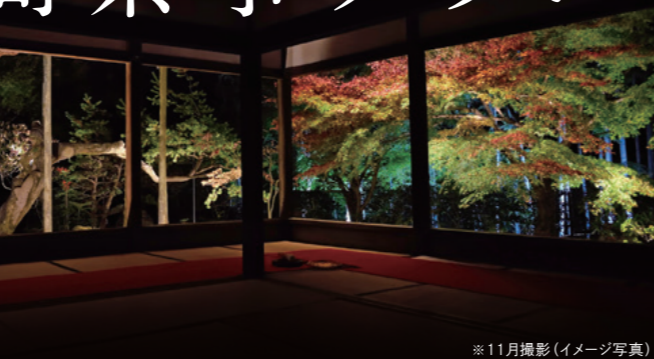
※11月撮影(イメージ写真)

ご宿泊当日は宝泉院の茶室「日新庵」、翌日ははちかんの茶室「如春」で茶事を楽しんでいただけます。