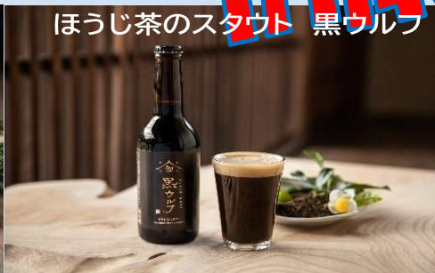
ほうじ茶のスタウト 黒ウルフ