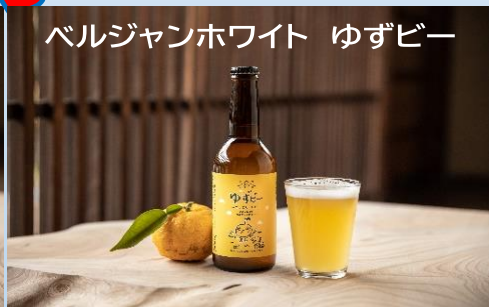
ベルジャンホワイト ゆずビー