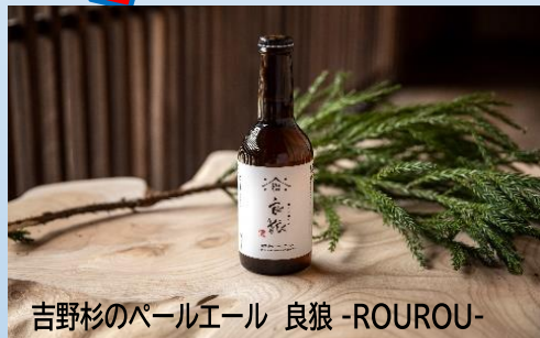
吉野杉のパーエール 良狼-ROUROU-