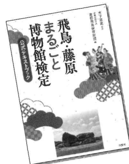
飛鳥・藤原まるごと博物館検定公式テキストブック

マークシート択一式で、60%以上の正解をもって合格とします。 (正解率で合否判定) ※合格者には認定証を交付します。