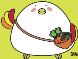
磯城野高校 公式マスコット しきのいろどりん