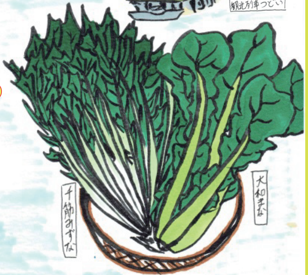
イラストはイメージです。

出発日 平成30年3月21日(水・祝) 雨天決行・荒天中止 募集人員 70名(最少催行人員50名)